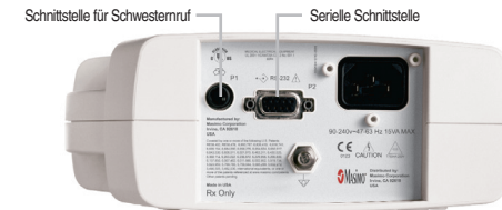
Rad-8, Rückseite: Serielle Schnittstelle für kompatible Geräte und Schnittstelle für Schwestererruf.